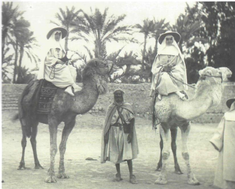
De witte karavaan

Een welkome aanvulling op de tentoonstelling is het boek Dragers van Hoop, Een leven lang missie, 150 jaar missiezusters van O.L. Vrouw van Afrika voor € 10,- te krijgen via www.wittezusters.nl . Negen-tien portretten die de levens en drijfveren beschrijven van de laatste generatie Witte Zusters in Nederland. Vrouwen die hun mannetje stonden.